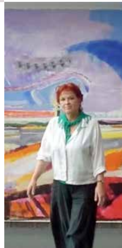
Muurschilderingen van tien meter:

'... gaat over wat me raakt en waarover ik me zorgen maak, niet over dat ik er niets aan kan doen. Want ik vind dat ik er op mijn manier wél iets mee kan. Als mensen aan mijn schilderijen zien hoe mooi alles is, gaan ze